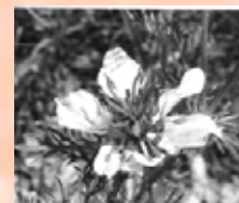
Nigelle de France

Le coteau de Peyroutet présente une diversité singulière de faciès de landes, pelouses et boisements, due notamment à sa morphologie en "fer à cheval" offrant de multiples orientations. Ces physionomies illustrent chacune une étape différente dans l'évolution naturelle d'un coteau calcaire ensoleillé, depuis l'état de roche à nue jusqu'au boisement thermophile. La pelouse calcicole est ainsi largement associée à la lande à genévriers, plus ou moins dense selon les secteurs et atteignant parfois un stade pré-forestier. Deux habitats d'intérêt communautaire dont 1 prioritaire ont pu être identifiés. Hormis la grande valeur paysagère qu'elles représentent, ces caractéristiques, associées aux conditions stationnelles et à une ambiance quasi méditerranéenne, sont à l'origine du développement d'un cortège floristique riche et peu commun en Aquitaine. Parmi les quelques 130 espèces observées, on compte 28 orchidées et près d'une dizaine d'espèces rares et remarquables. Deux d'entre elles bénéficient d'une protection nationale : l' Orchis parfumé et la Nigelle de France . Cette dernière et l' Ophrys du Gers trouvent ici les seules stations connues en Aquitaine.